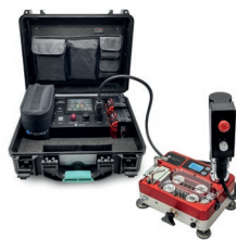
MOTORE ELETTRICO + APP