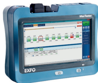
OTDR EXFO MAX-730D