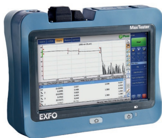
OTDR EXFO MAX-720D